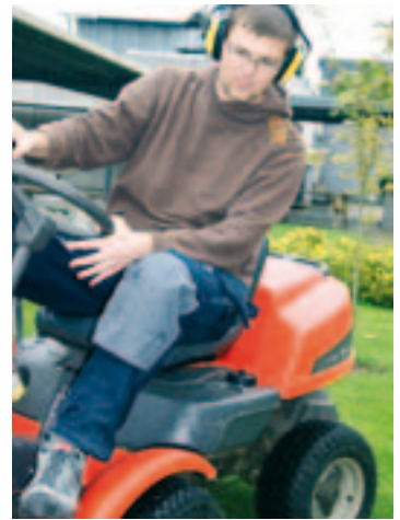
Eleverne gennemgår en alsidig uddannelse, som giver dem færdighederne til at løse mange forskelligartede opgaver.